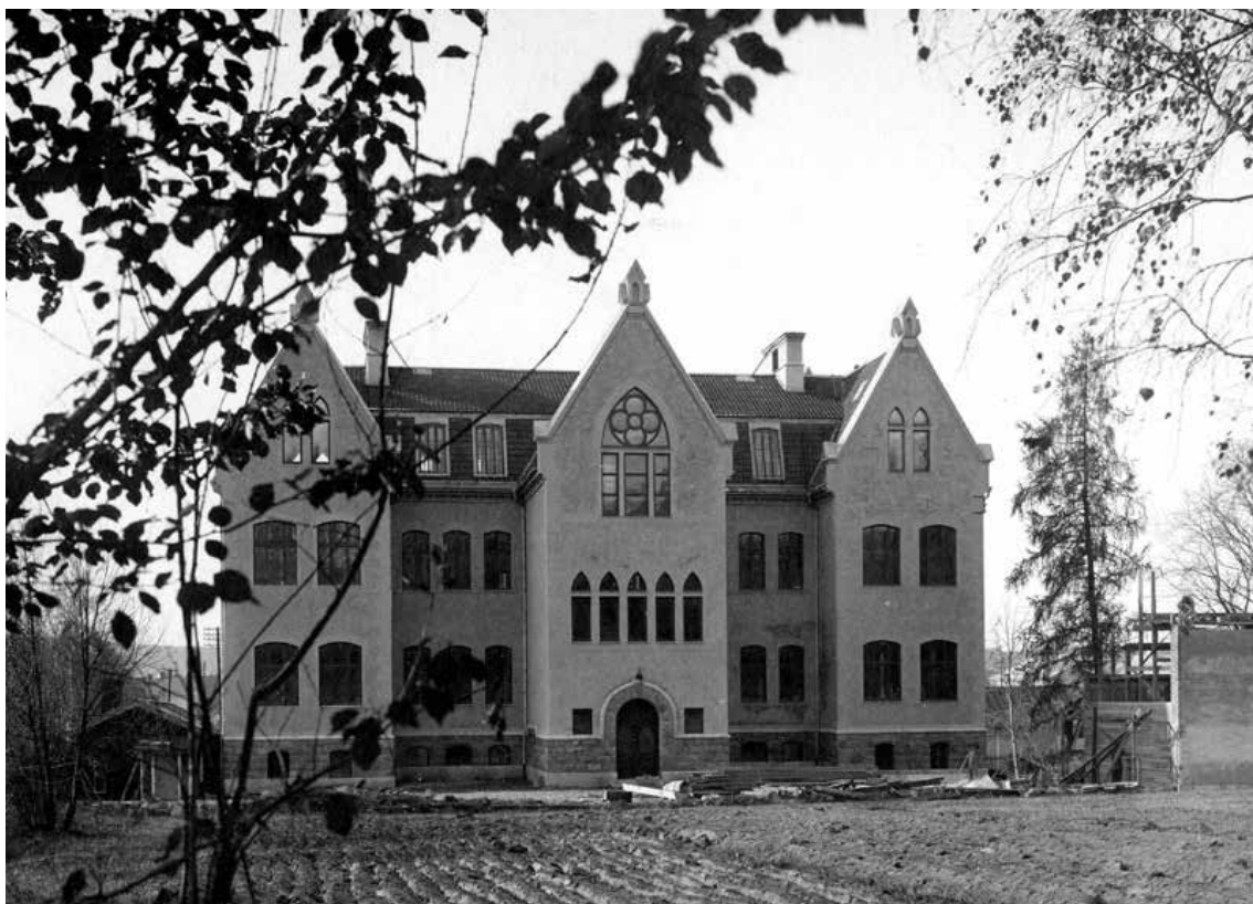
Valhallas nordöstra fasad strax efter att byggnaden stod färdig 1903. Uthuset till höger är ännu inte färdigt. Den stora granen är med största sannolikhet samma som finns där idag.