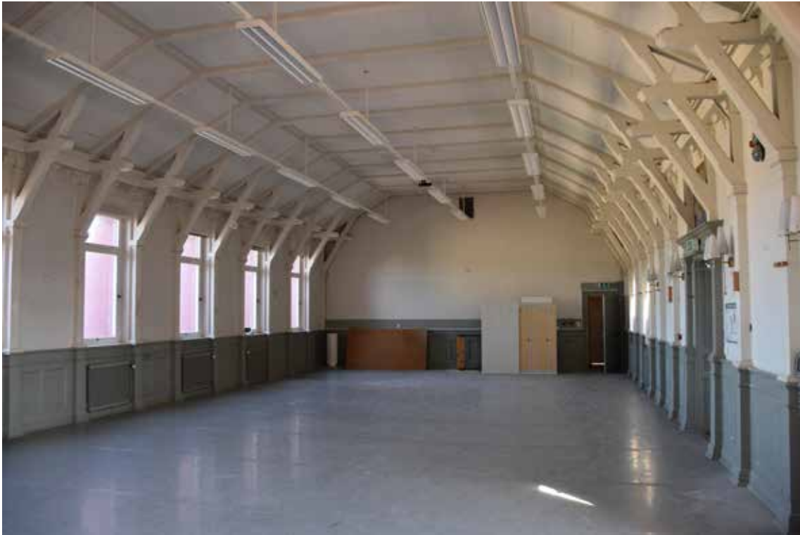
Aulan med sin fulla rumsvolym. Trots många förändringar bibehåller rummet många av sina ursprungliga kvaliteter