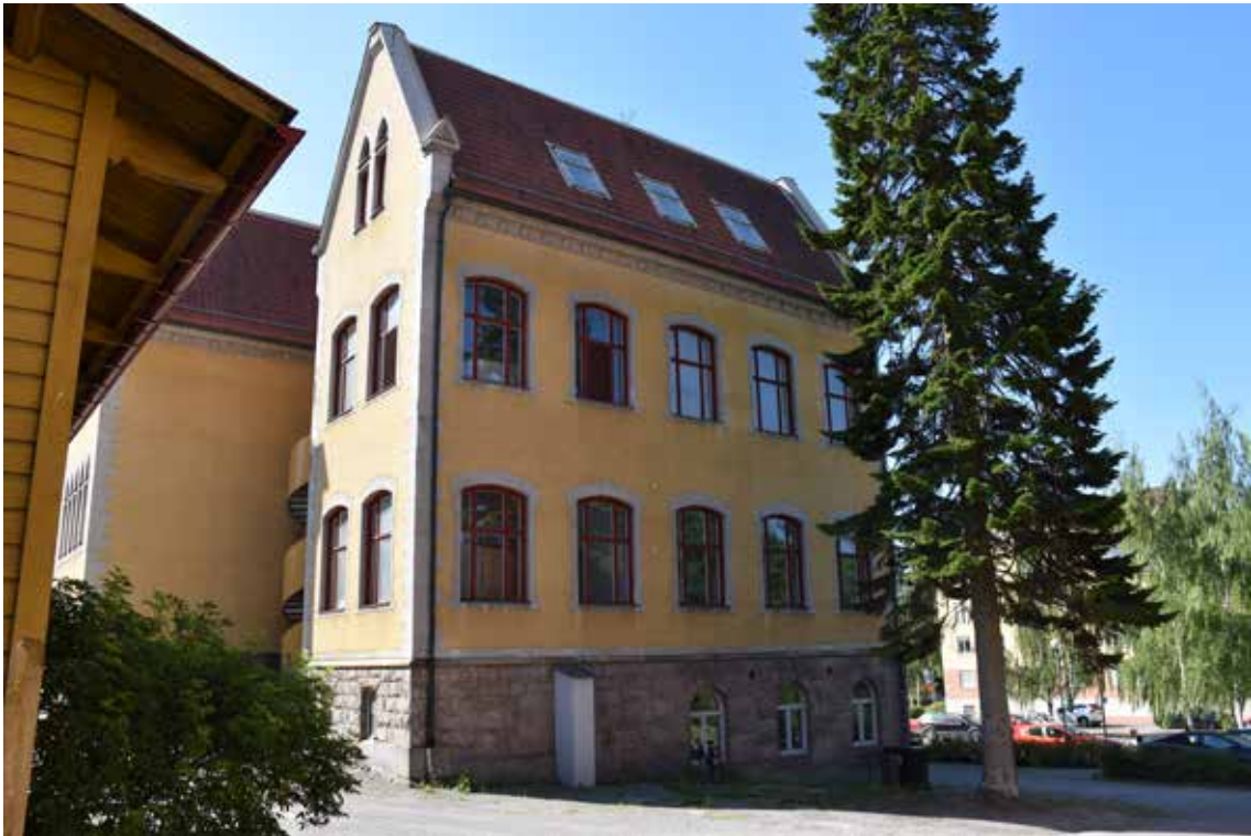
Valhallaskolans nordvästra gavel sedd från innergården. Strax vänster om granen vill man uppföra ett hisschakt