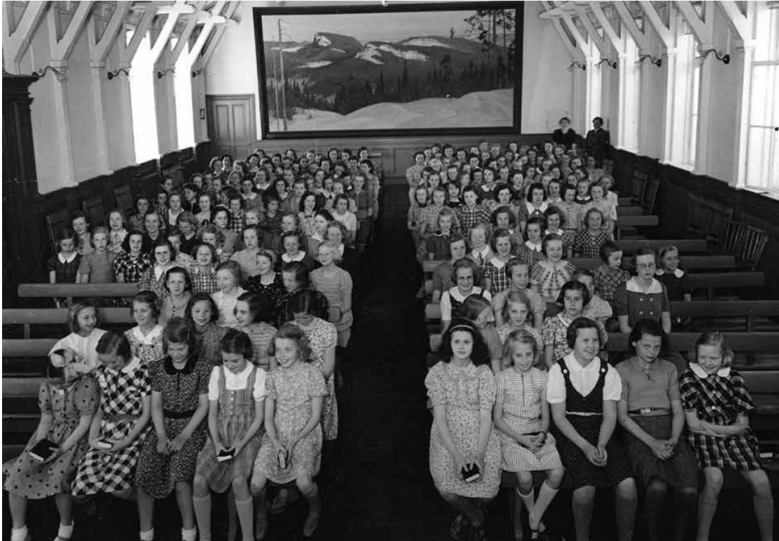
Foto på elever sittandes i aulan på vindsvåningen, troligen 1950-tal.

Detta bebyggelsehistoriska skede lade grunden för modern stadsplanering så som vi känner den idag, samtidigt som arkitekturen som växte fram i hög grad var en produkt av tidens socioekonomiska omdaningar. Dessa omdaningar var inte minst kännbara i Falun, en stad som genomgick stora förändringar under denna tid. Perioden ca 1870-1910 är avgörande för att förstå Falu stads moderna utveckling, då det är under denna period som staden på riktigt får en urban karaktär som inte bara präglas av den traditionella gruvdriften. Förutom nya stadsdelar så som Villastaden ser Falun under denna period även byggandet av ett helt nytt kasernområde för regementet, samtidigt som staden länkas samman med Gävle och Stockholm via järnväg. Flera av stadens stora lärosäten grundas även under denna period.