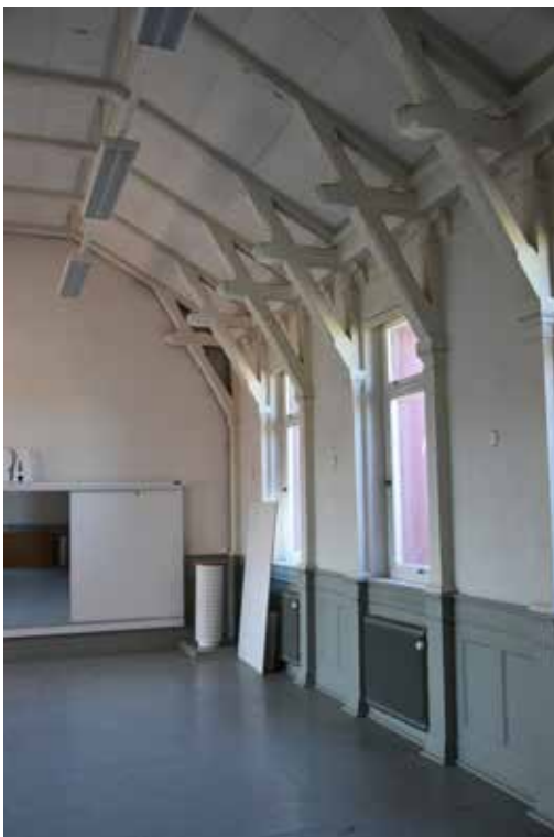
Ursprungliga takstolar, listverk och bröstpaneler är alla kulturhistoriska värdebärare