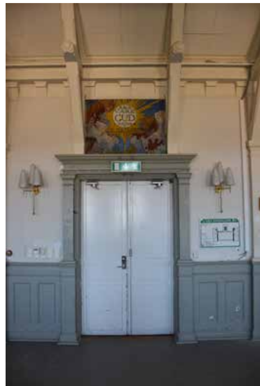
Utförliga dörrömfattningar med hög detaljrikedom som bevarats sedan byggnaden uppfördes. Dörrbladen har bytts vid senare tillfälle