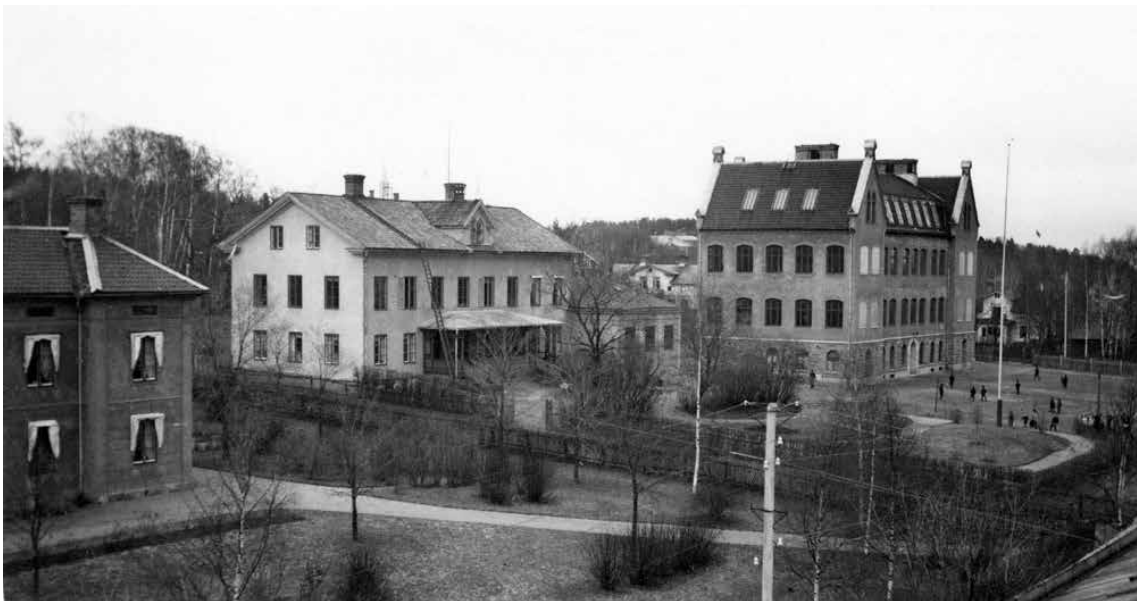
Valhallaskolan och det gamla utvårdshuset sett från nordväst, sannolikt under 1900-talets första hälft. Bilden visar att skogsgårdstomten i saknade vegetation och bestod av grusade ytor för lek och spel.