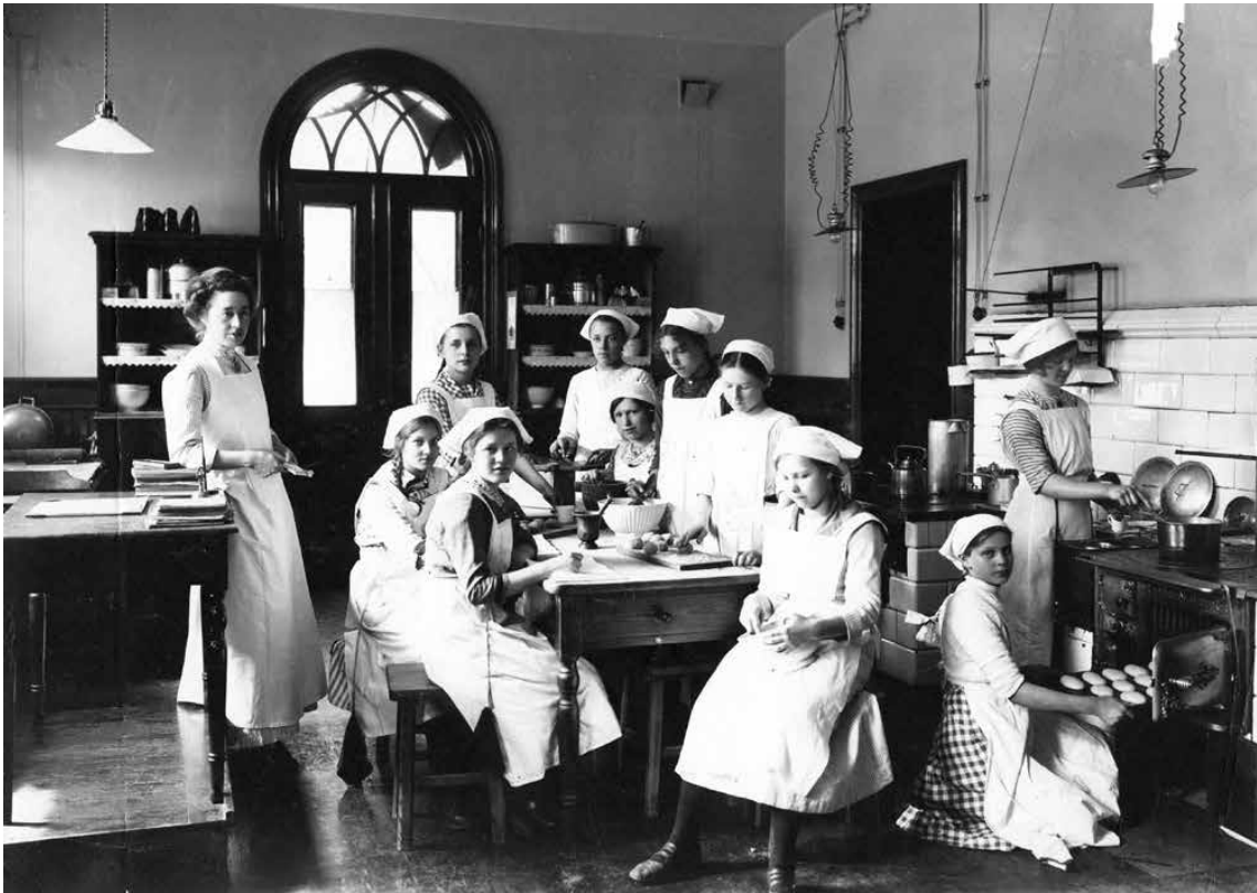
Klassfoto från skolköket, 1900-talets första hälft.