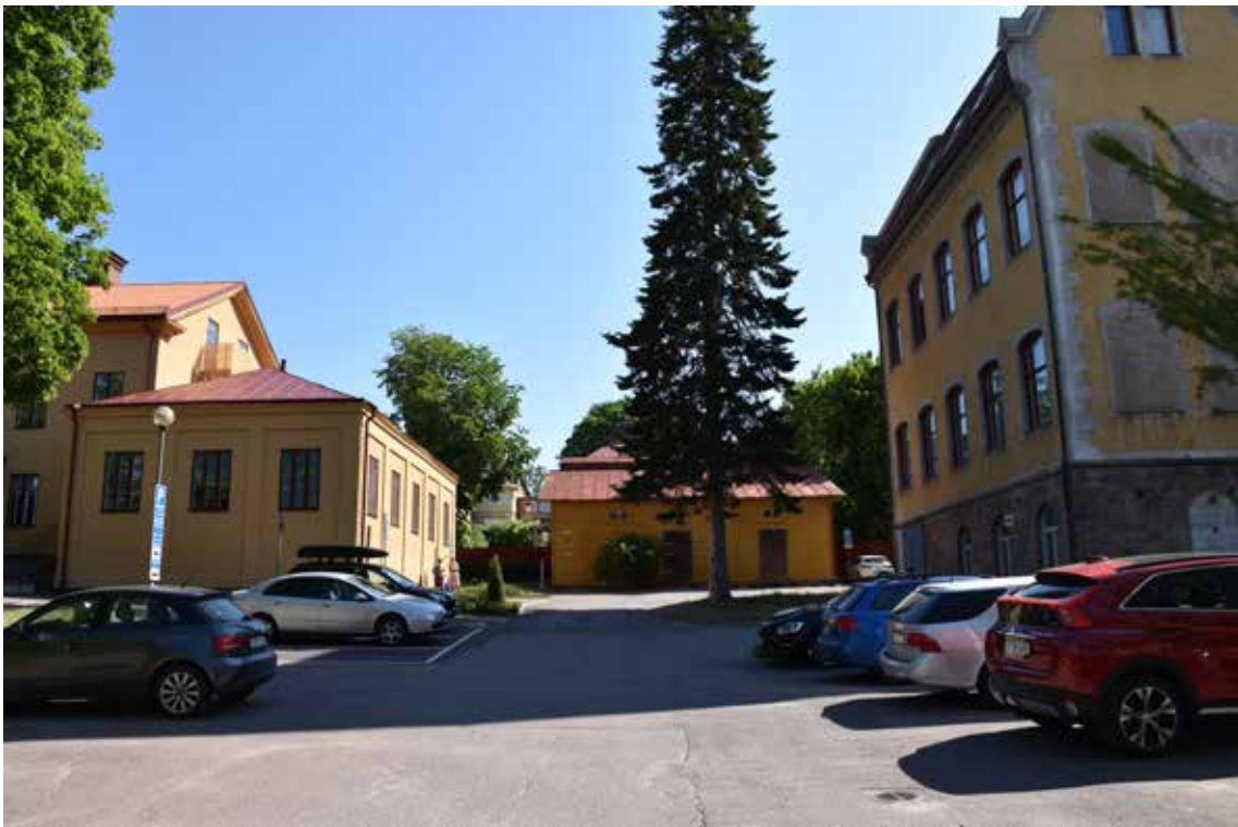
Den kringbyggda innergården sedd från parkeringen. Valhallaskolans nordvästra gavel ses till höger i bild