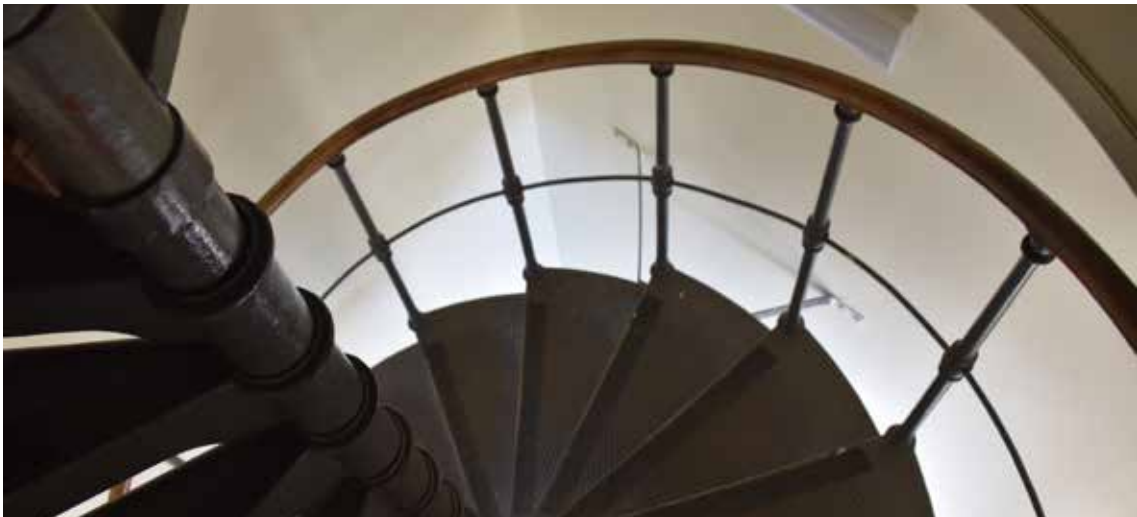
En av två symmetriskt placerade spiraltrappor av gjutjärn.

Stora delar av skolbyggnaden är märkbart utformad för att framhäva aulans centrala plats, inte minst genom det stora trapphuset som högst upp kröns av ett färgsprakande rosettfönster överblickandes aulans entré.