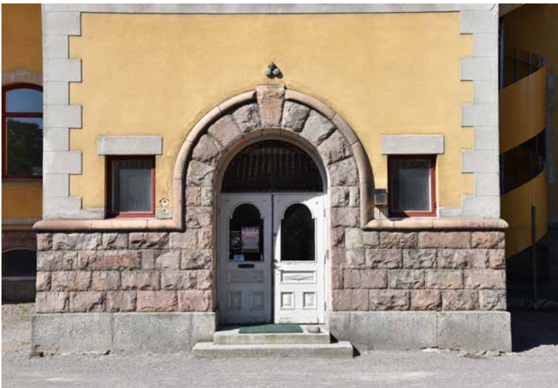
Lilla entrén mot sydväst, med en välartikulerad grund i röd och grå granit. Lägg även märke till det kraftiga dörrvalvet.