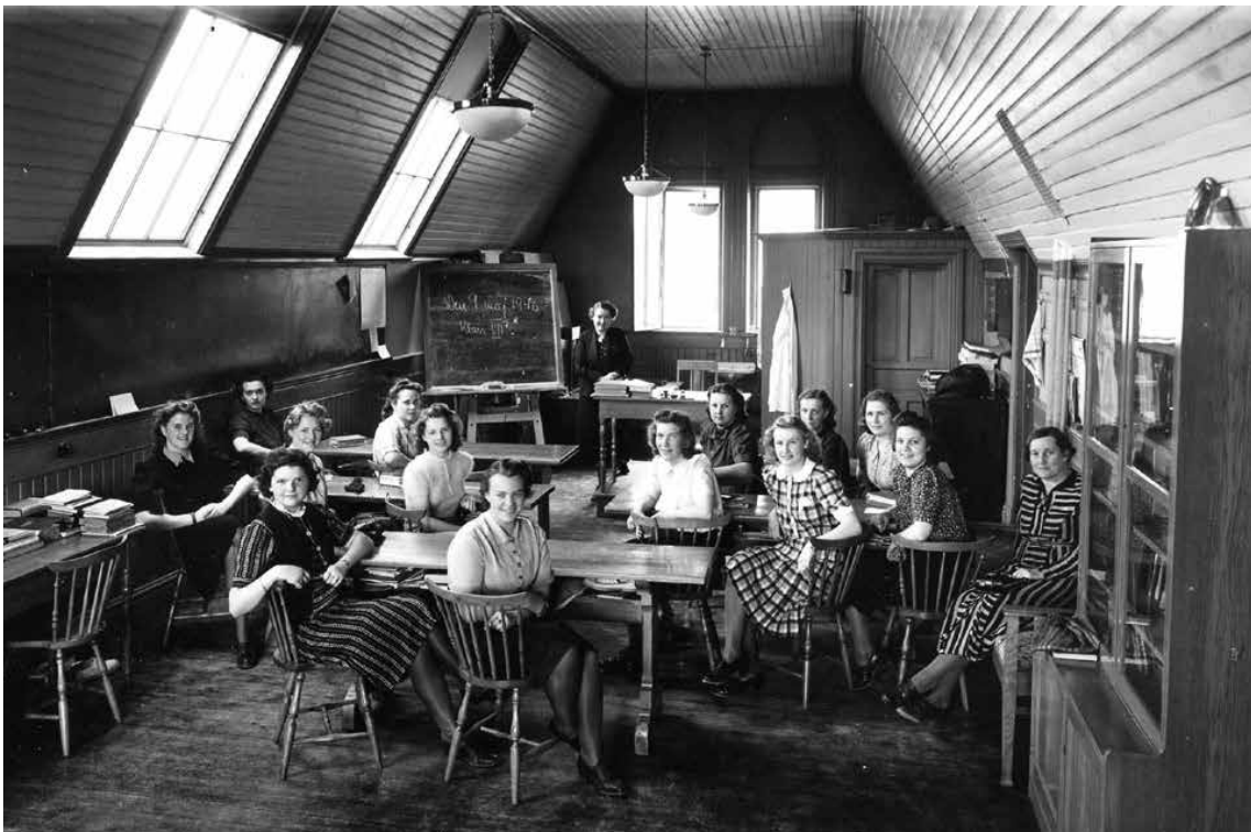
Klassfoto taget i vindsutrymmet på en av sidoflyglarna. På griffeltavlan står: "Den 9 maj 1940, klass VII".