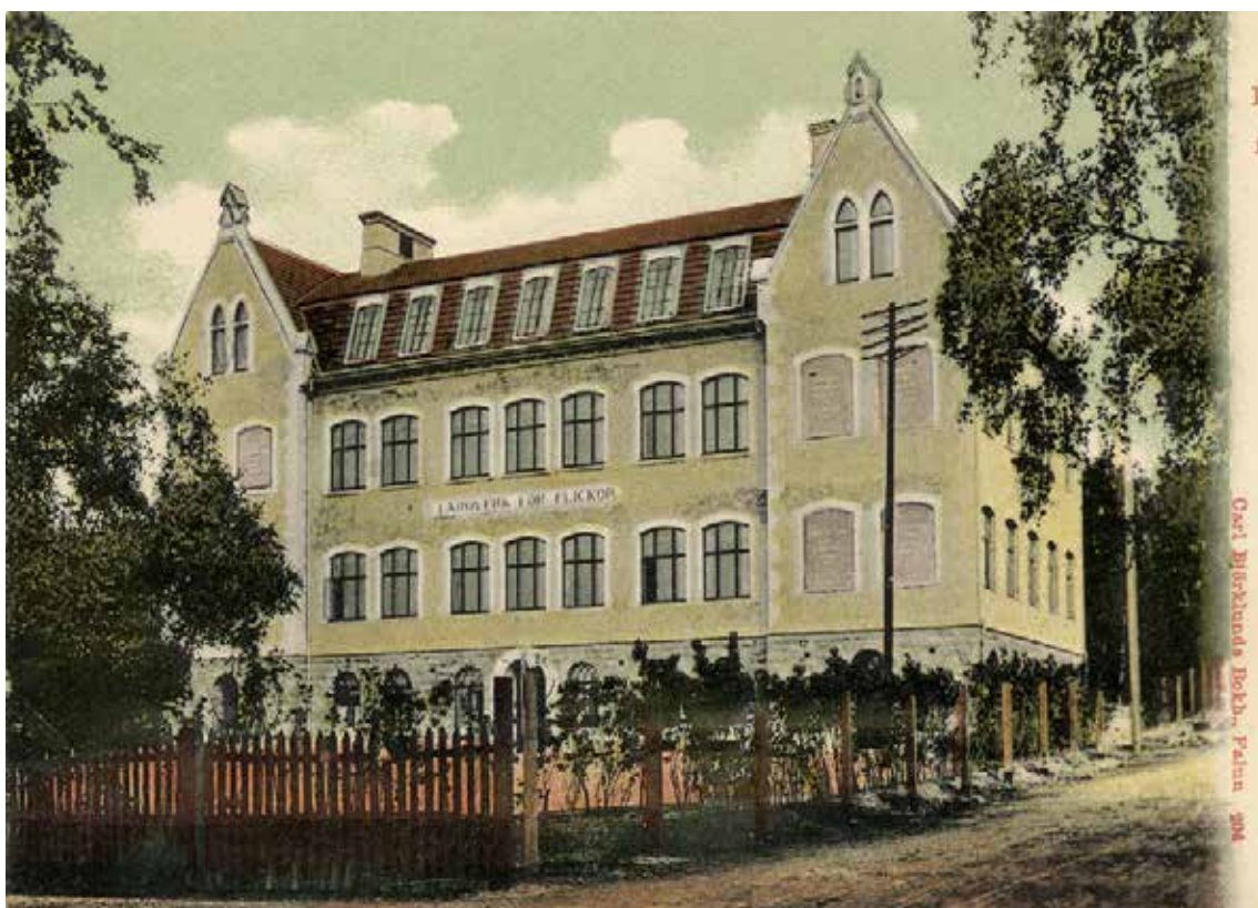
Handkolorerat vykort med flickskolan Valhalla sett från söder, troligen 1910-tal. Skolgården avgränsas längs Daljunkaregatan av ett rödslammat spjälstaket. Stolparna längs Svärdsjögatan tyder på att ett spjälstaket skall uppföras även där. Den nyplanterade häcken innanför staketet förefaller vara av syrén. Kulturnämndens bildsamling, Falu kommun.