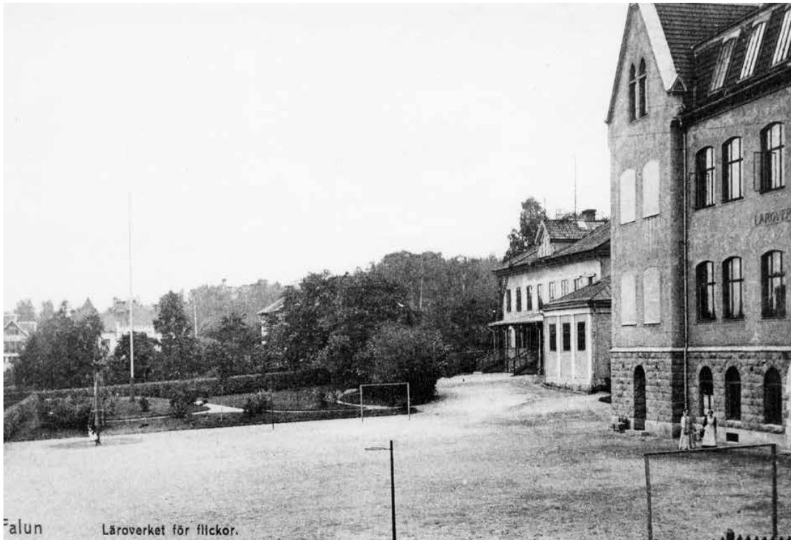
Falun Läroverket för flickor. Foto av beletsmiljön med skolgård och skolbyggnad. I bakgrunden syns en park och Utvärds huset som tidigare hyste Flickskola.

invigdes sommaren 1903 efter en total byggnadskostnad om 109.600:-. Av denna summa bestod hela 36.526:- av publika gåvor och donationer.