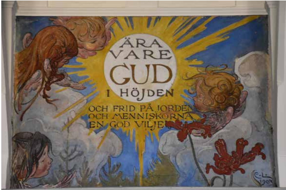
Carl Larssons väggmålning signerad 1907, med texten "Ära vare gud i höjden - och frid på jorden - och människorna en god vilje"