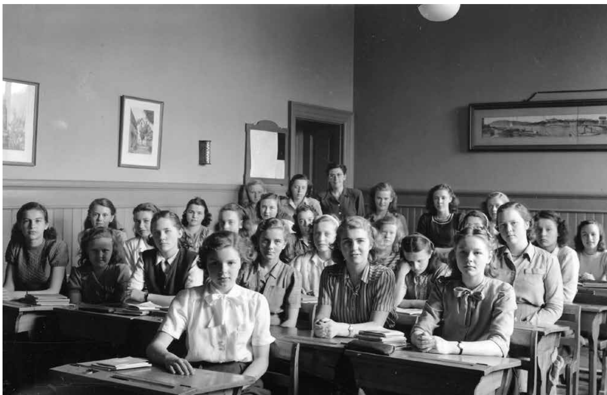
Skolklass i ett av Flickskolans klassrum, omkring 1930-tal.