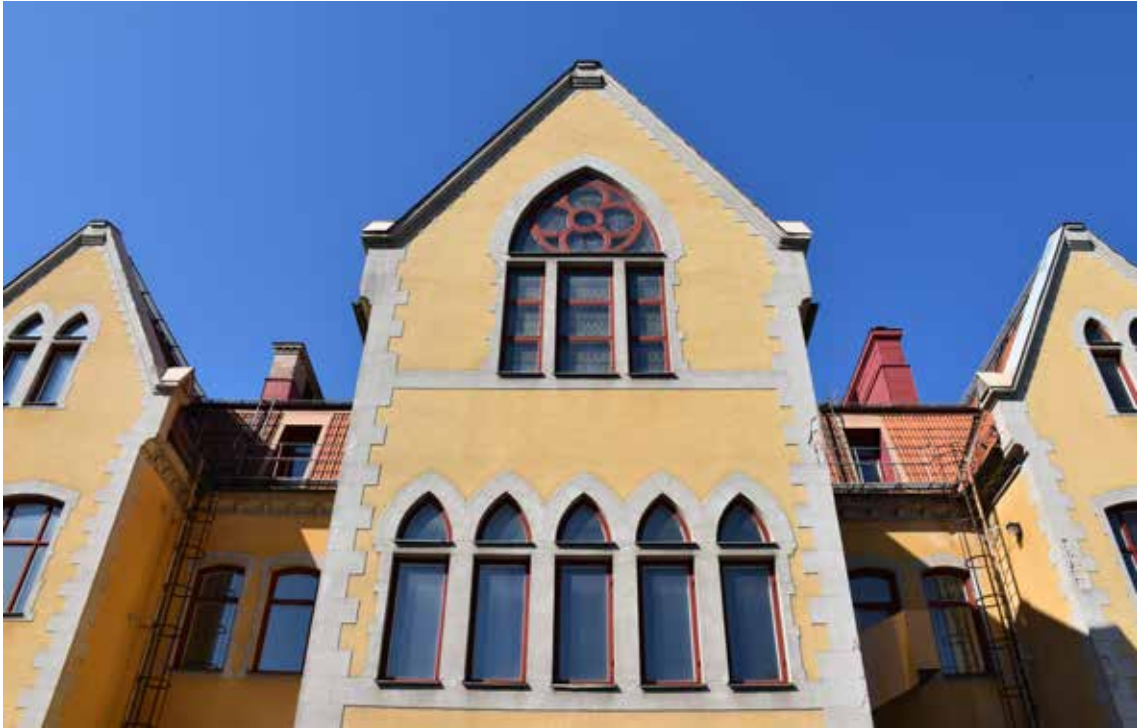
Fasaden mot nordost, med stora nygotiska fönster i mittrisaliten.