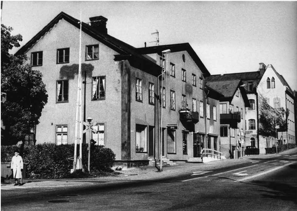
Skolbyggnaden tittar fram längst bort på gatan. Foto taget i korsningen Svärdsjögatan-Promenaden, troligen sent 1960- eller tidigt 1970-tal.