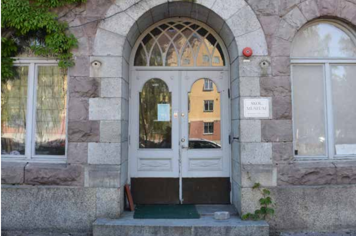
Entrén mot skolgårdssidan med välvda fönster och stenomfattningar.

Den stora granen nordväst om byggnaden är över 100 år gammal och fanns på platsen då byggnaden uppfördes. I dess bark finns trädristningar, sannolikt utförda av skolbarn. Granen berättar om skolbarnen och deras förstörelse och är således kulturhistoriskt värdefull.