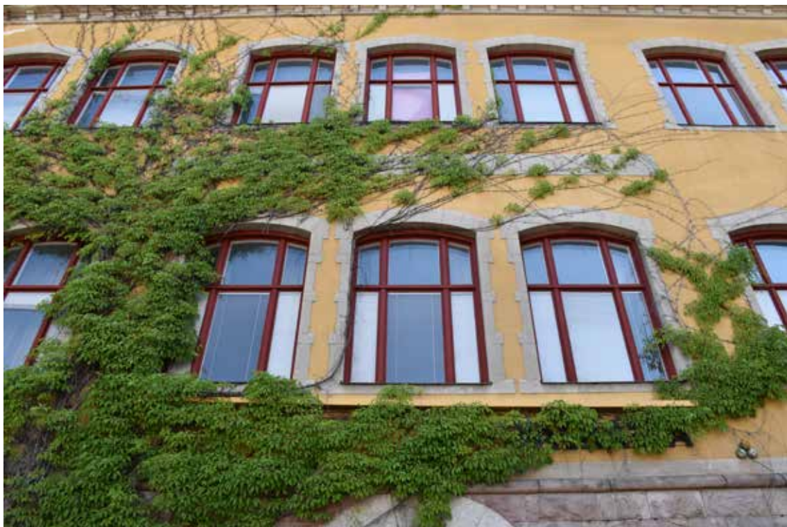
Bakom klättrväxter skymtar Flickskolans gamla skylt, en viktig värdebärare för byggnadens äldre historia