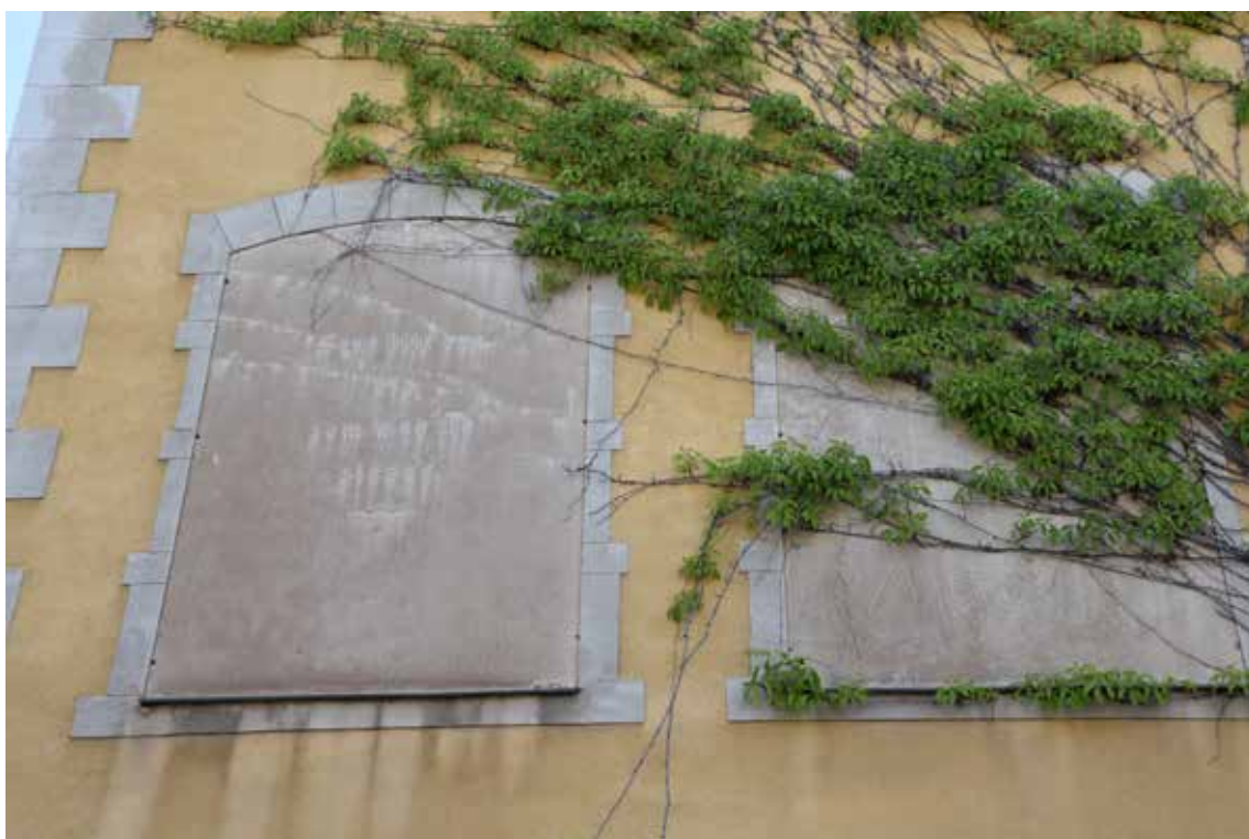
Blindfönster med citat och talesätt som på ett eller annat vis kan kopplas till den äldre skolgången