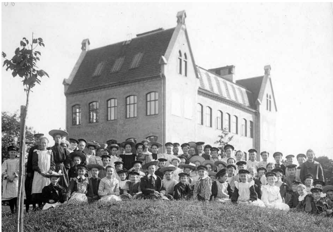
Gruppen med elever och lärarinnor framför den nya skolan. Daterat till sommaren 1906.