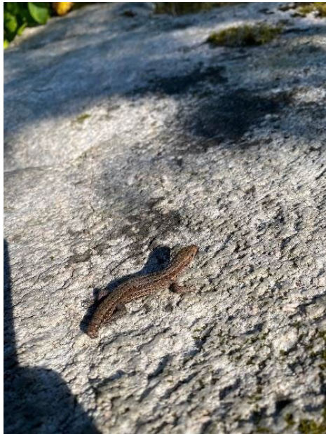
Bild 1. Bild på skogsödla som finns i planområdet.

föras fram för eventuellt antagande av Falu Kommunfullmäktige.