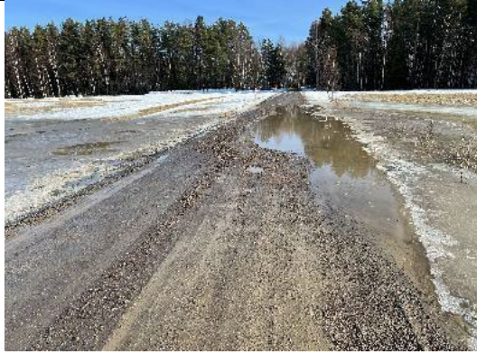
Bilden visar skicket på vägen i mars 2022 på samma ställe som bilden i Trafikutredningen (sidan 9)

Obefintlig trafiksäkerhet för barn och vuxna i området ökar behovet av bil