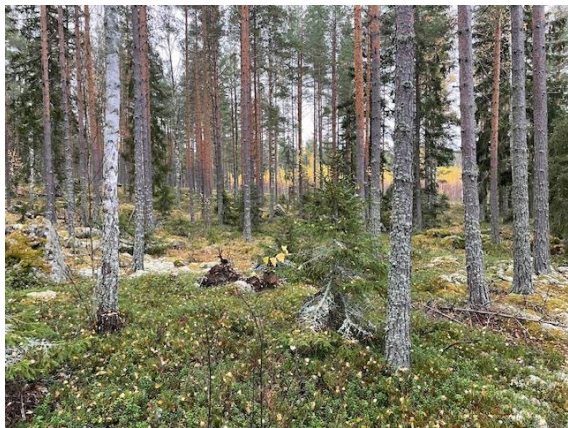
Bild 2. Området från Norr till Söder "Lekplatsen" som ligger i direkt anslutning till omgivande bebyggelse. Att anlägga en lekplats på den platsen innebär att det blir omöjligt att bibehålla karaktären i området med att band annat spara flertalet större stammar.