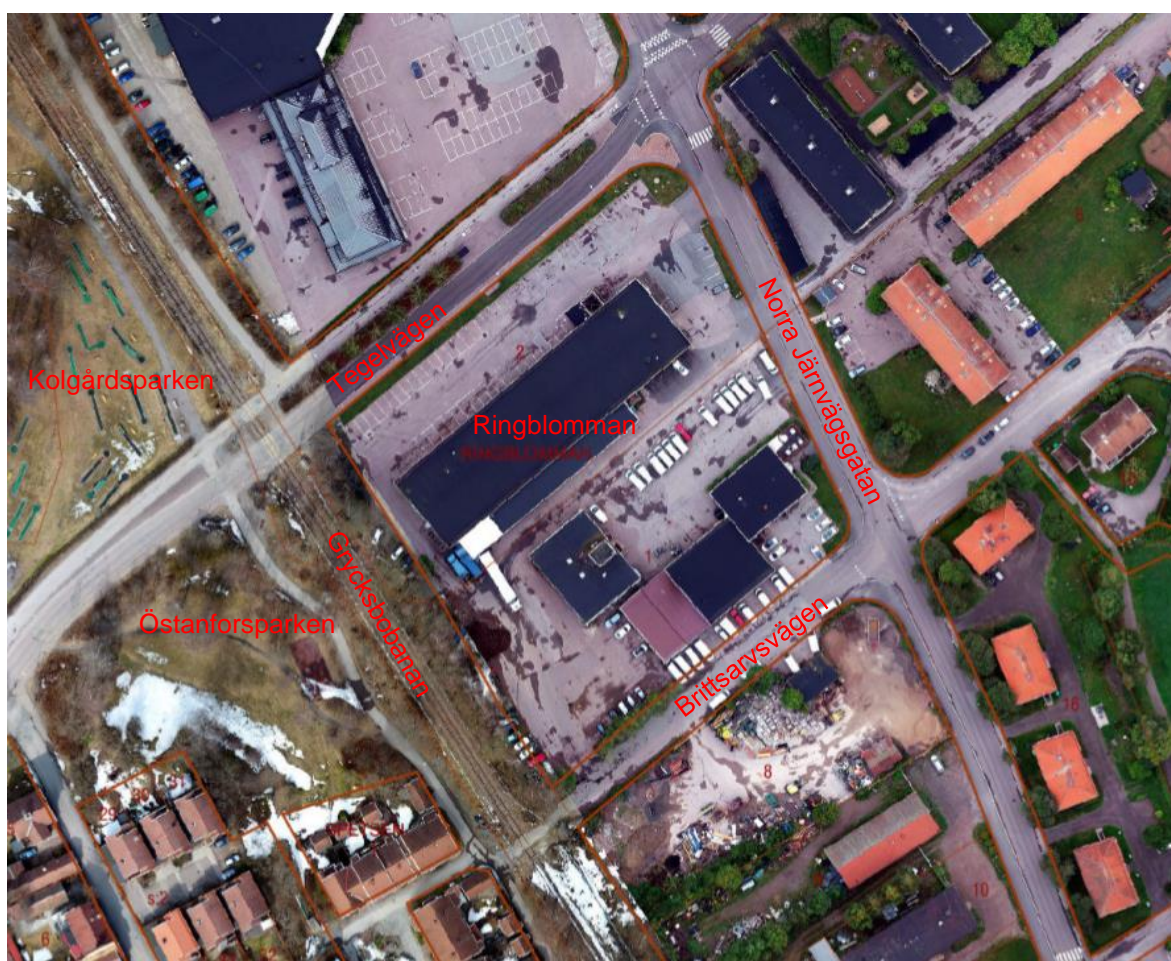
Kvarteret Ringblomman idag

Det finns inga kända fornlämningar i kvarteret Ringblomman.