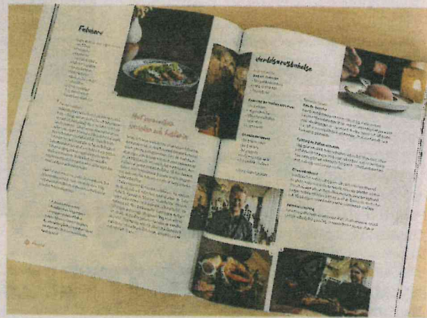
Boken finns nu att köpa i butik. Den delades även ut till Faluns nya kommuninvånare under medborgarskapsceremonin på nationaldagen.