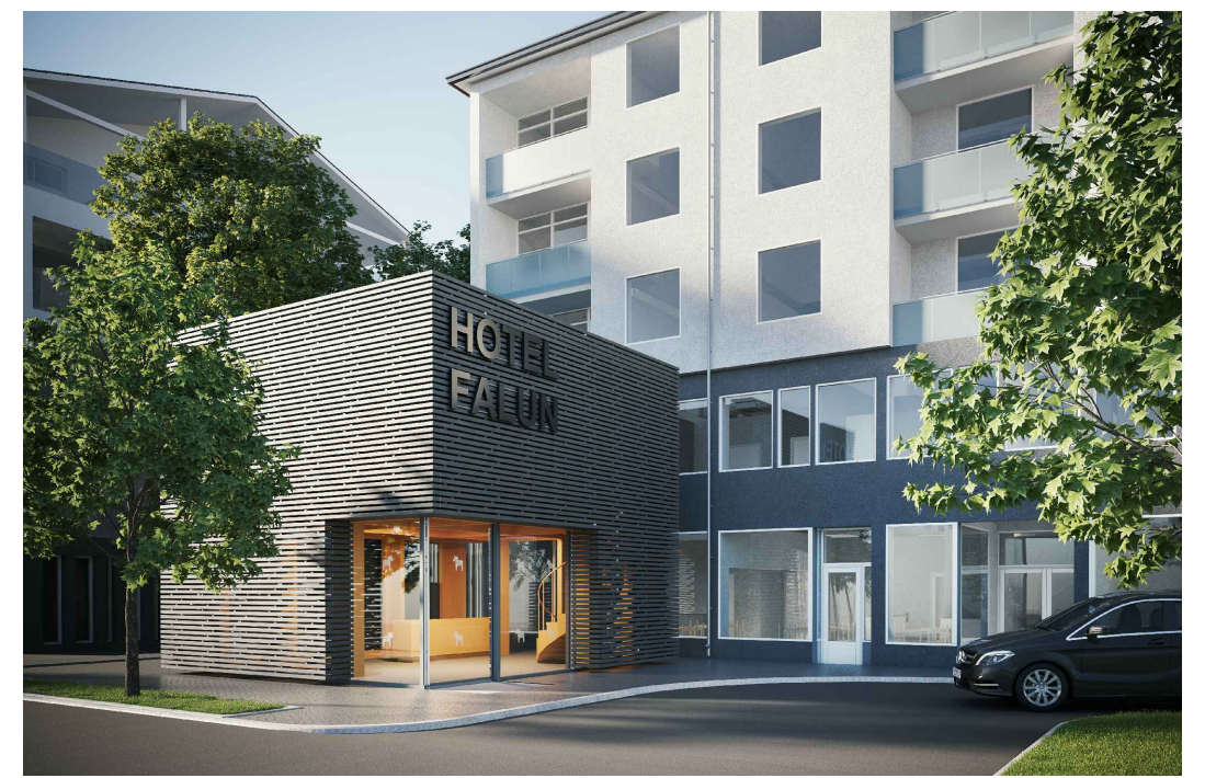
Förslag på möjlig utformning av hotellentrén. Illustration: Liljewall arkitekter