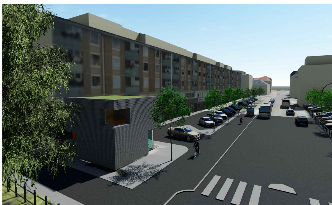
Vy från nordväst på möjlig utformning av hotellentrén. Illustration: Falu kommun

Byggnader inom planområdet ska utformas och utföras så att naturligt översvämnande vatten inte skadar byggnaden, teknikbyggnader eller liknande.