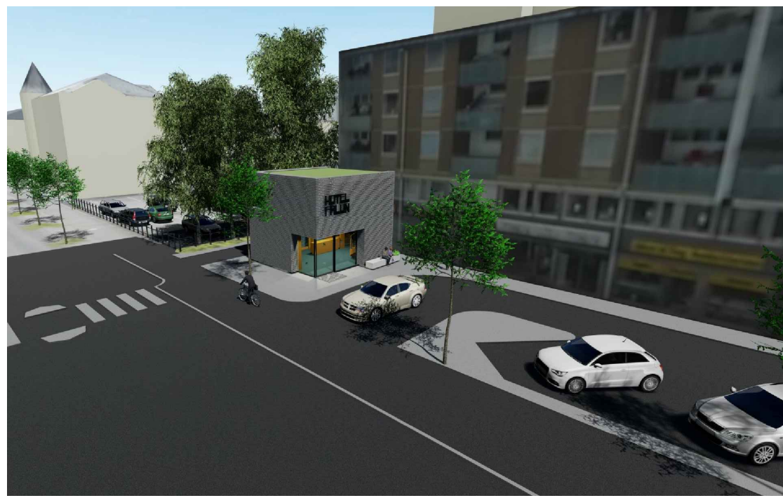
Vy från sydväst på möjlig utformning av hotellentrén. Illustration: Falu kommun