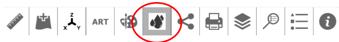
Figur 2. Högst upp till höger under ikonen med tre vattendropparna i menyraden i GIS-stödet för små avlopp finns det digitala verktyget.

I GIS-stödet för små avlopp på länsstyrelsens webbplats finns ett digitalt verktyg som utgår från denna manuella metod. Genom att lägga in minst tre mätpunkter i den digitala kartan och ange observerad grundvattennivå i dessa beräknar verktyget riktningen och grundvattenytans lutning. Efter att beräkningen gjorts är det möjligt att skriva ut en rapport med resultatet som kan bifogas ansökan. Verktyget ligger under ikonen med tre vattendropparna i menyraden högst upp till höger i GIS-stödet, se figur 2.